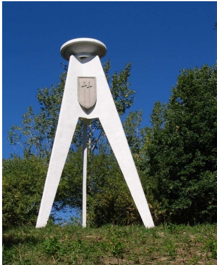
fot. pomnika ku czci ofiar faszyzmu

W miejscowości znajdują się miejsca pamięci po ofiarach II wojny światowej zakatowanych przez hitlerowców są to pomieszczenia, gdzie przetrzymywano więźniów i cmentarz z pomnikiem upamiętniającym pomordowanych.