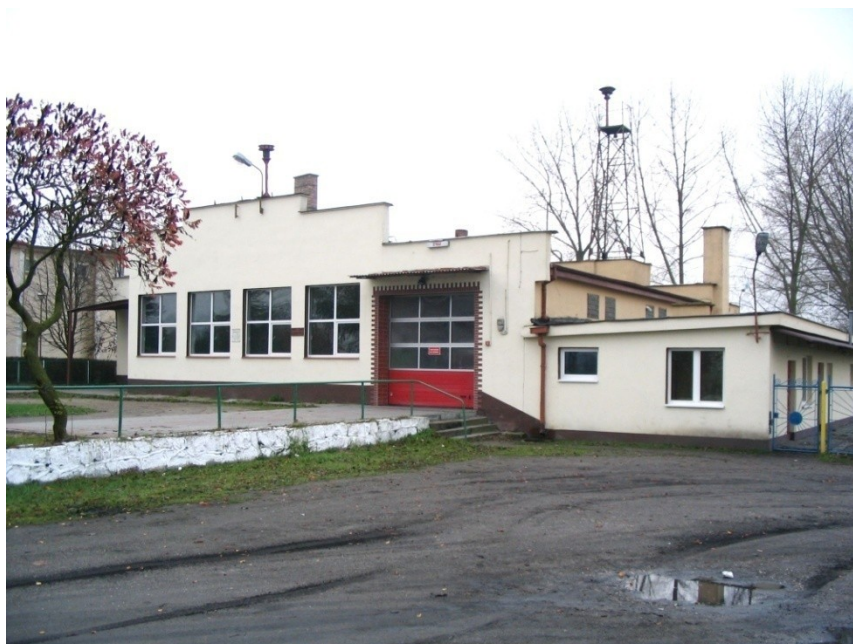
Fot. Świetlica wiejska w Kijewie Królewskim