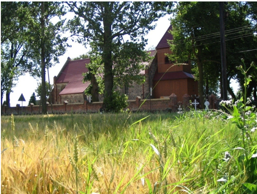
Fot. Kościół parafialny w Kijewie Królewskim